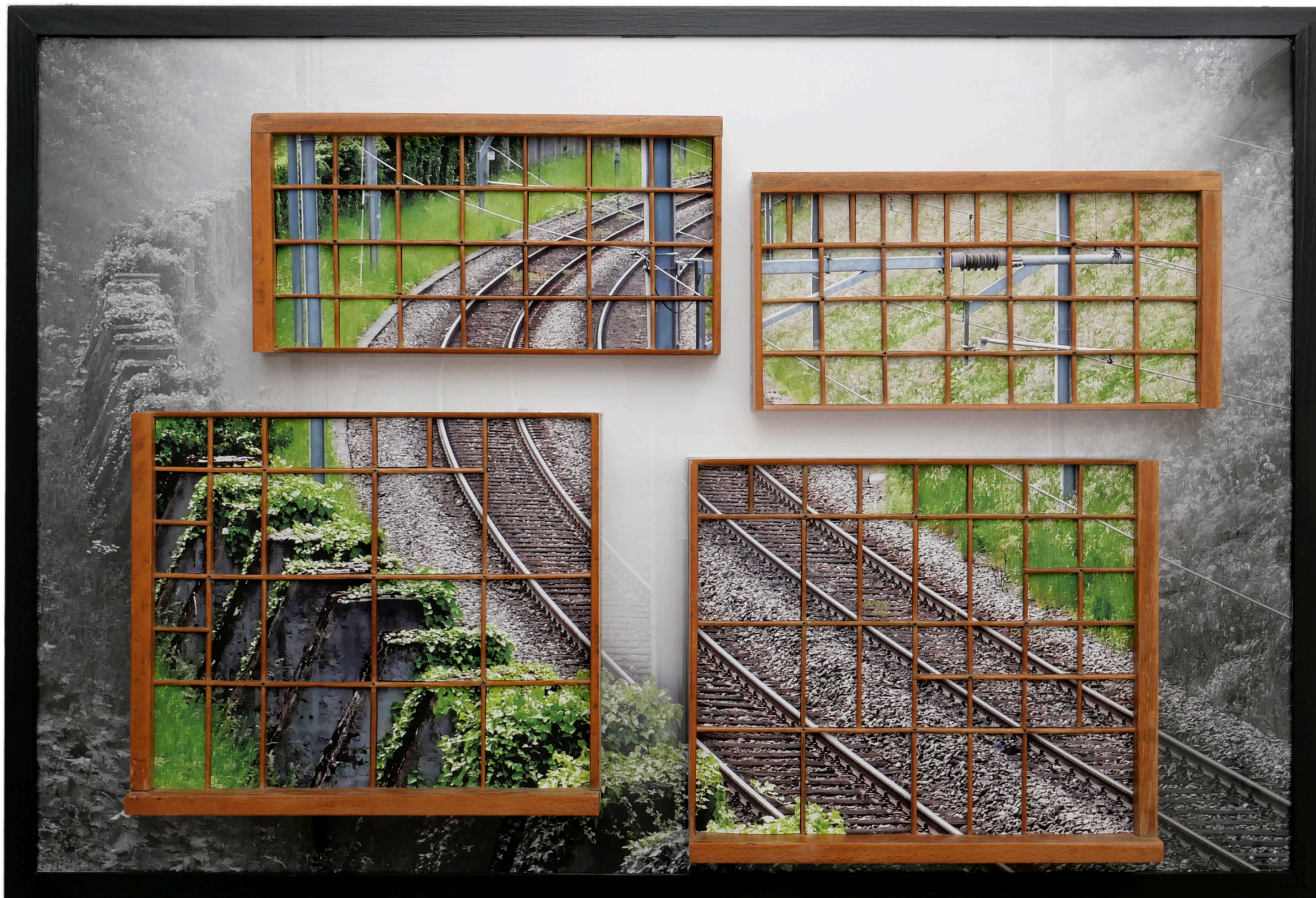
„Irrwege“ (Setzkasten 01-a), 2023/2025 Holz, Photographie, Acrylglas