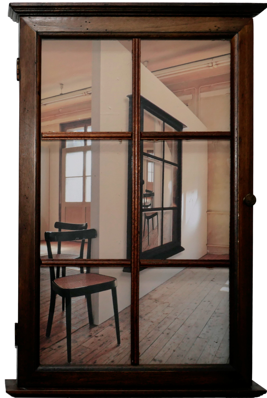
„Innen und Aussen“ (Vitrine 03), 2021/2025 Holz, Photographie, BHT ca. 80 x 60 x 8 cm