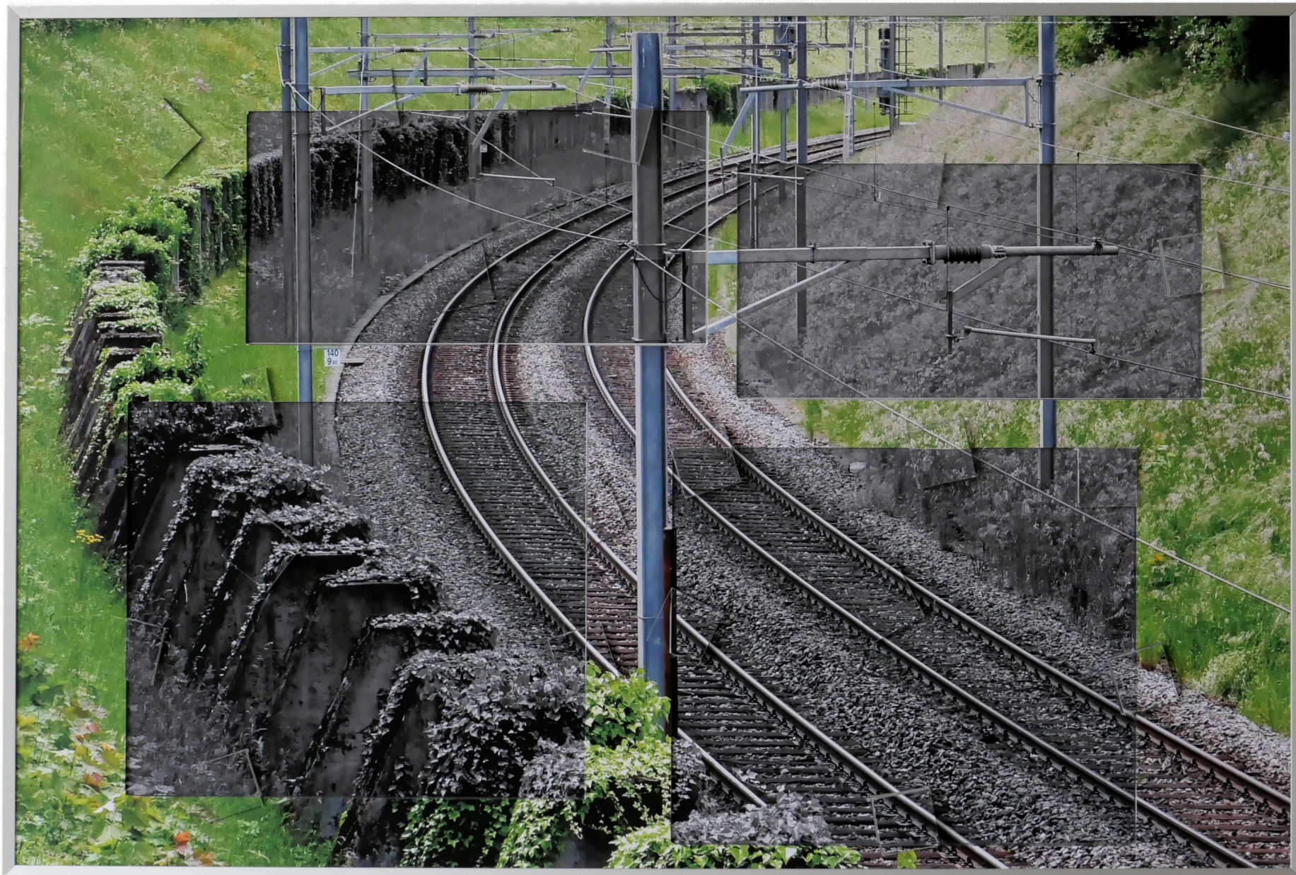
„Abgründe“ (Setzkasten 01-b), 2023/2025 Photographie, Acrylglas, Aluminium